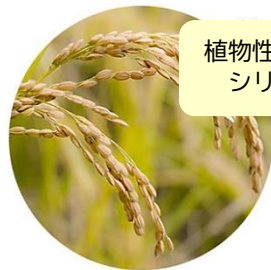
植物性有機シリカ